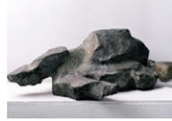
Margret Middell: Liegender, 1995

Sein Medium ist die Fotografie: "Ich sehe meine Fotografie als Zeichen dessen, was über das Gegenständliche am Gegenstand hinausweist", sagt der Künstler.