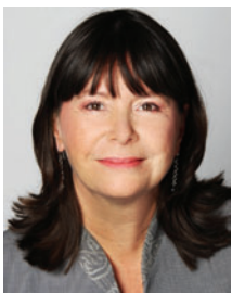
Ulrike Höfken Ministerin für Umwelt, Landwirtschaft, Ernährung, Weinbau und Forsten Rheinland-Pfalz